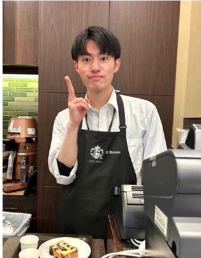
アルバイトをしているときの写真