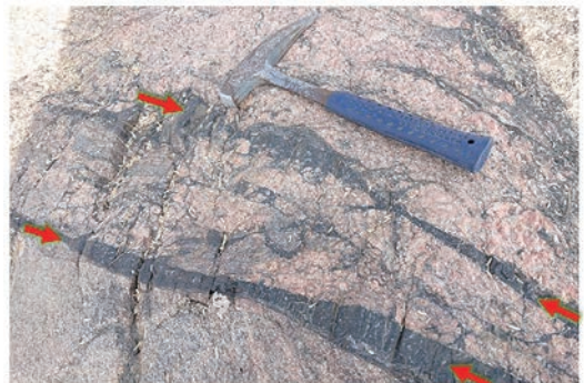
図1: 花崗岩中に発達するシュードタキライトの露頭写真。インド、Rajasthan州で撮影。赤い矢印はシュードタキライトを伴う断層を示している。黒色部分がシュードタキライト。シュードタキライトは一般的に黒色を呈する。

世界中の研究者によるシュードタキライトの研究から、断層形成には水が関与していることや、どのような鉱物が選択的に溶け、どうしてずれの伝搬速度が秒速1 mと早くなるのかなどが明らかにされています。今後更に、地震発生の謎がシュードタキライトの研究から明らかにされると思います。現時点では地震は予知できません。しかし今後、シュードタキライトを伴う断層の調査やシュードタキライトの微細組織観察、観測機器の更なる充実による地震学の進展、地震の再現実験、そしてAIを駆使した研究により、困難ではありますが、いつの日か地震予知が可能になり地震災害が減ることを期待したいと思います。