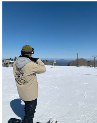
趣味（スノボー）の写真

クル・部活動などといった様々な活動に参加する自由が増えるためであり、こう言った様々な選択肢の中にこそ未知の可能性や数々のチャンスが広がっています。大学時代の貴重な時間を有意義に過ごすために、自分の抱いた好奇心や興味を大切にし、新しいことに積極的に挑戦してください。小さな経験も大きな宝物になり、些細な経験や少しの価値観の変化が、自分の成長や将来への新たな方向性を示す手がかりになり得るでしょう。そして、そういった何事にも挑戦する姿勢が、新しい可能性を切り拓いてくれることを信じています。大学での経験が、あなたの人生を豊かにし、成長させてくれることを心より願っています。素晴らしい大学生活をお楽しみください。