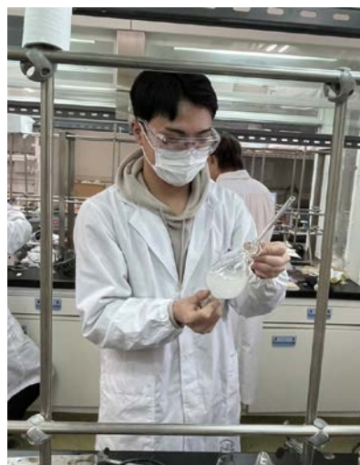
学生実験中の筆者

最後になりますが、みなさんには多くのことに挑戦をして、多くを学ぶような豊かな学生生活にしていただけだと思います。もし、学生生活で困ったときは友達や先輩、または学生プラザ（学生生活や履修に関する相談を受けてくれます）に程々に相談しましょう。