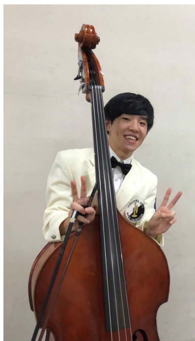
サークル時代の一枚

ただ、院進にはメリットがたくさんあります。簡単にまとめると、専門分野のより深い内容、大学の先生方の凄さや研究の面白さというものを知れます！また、就活する場合、学部時代よりも広い視野と多くの