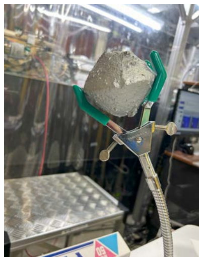
昨年利用した STXM と小惑星リュウグウの模型

地球惑星システム学プログラムでの研究は、複雑な実験や試料の測定、得られたデータの解析、多くの先