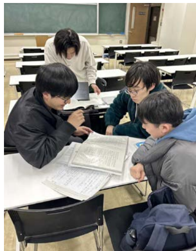
空きコマのひととき（手前左端が筆者）

知ること以外にも面白いことはたくさんありますが、それらは他の方が伝えると期待して私の主張を終えたいと思います。新入生の皆様が面白いと思える大学生生活を送れるよう、心よりお祈り申し上げます。