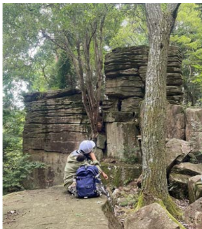
広島県呉市野呂山 大重岩

幸いなことに、広島大学は総合大学、しかも東広島キャンパスには多くの学部が集結しているので、他学部の授業も参加し放題です。大学は専門教育を受ける場所でありながら、学問を通じて視野を広げる場でもあります。この広島大学で、新入生の皆様の視野がさらなる広がりを見せますように、心から願っています。