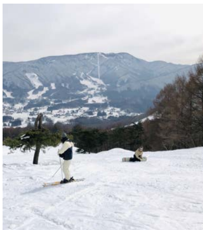
1 番最初に回答してくれたAくん（右）

多くの人にとってどうでもいい話だったかもしれませんが、こんな変な文章あったな～程度に覚えていただければ幸いです。読んでいる皆さんの大学生活が実りあるものになることを願って、この投稿を締めさせていただきます。ありがとうございました！