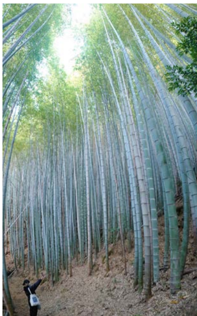
研究室のセミナーで訪れた竹林

大学に入って今までとは環境が大きく変わるとはありますが、自分が行動を起こさなければ何も変わることはありません。しかし、自分が望みさえすれば、どん