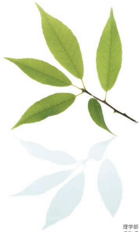
理学部の木「シラカシ」 威厳、勇気、忍耐を象徴する常緑高木です。