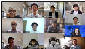
未来を拓く地方協奏プラットフォーム(HIRAKU)について、詳細はこちら https://hiraku.hiroshima-u.ac.jp/

▽長期インターンシップの成果報告(2名)・OBによる就職後の振り返り報告(1名)・受け入れ機関の講評(日本製鉄株式会社、国連訓練調査研究所広島事務所)・テニユアトラック教員着任報告(6名)