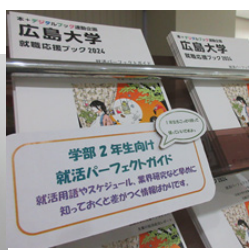
上: 就職応援ブック 左: 就活ハンドブック

東広島キャンパス・グローバルキャリアデザインセンター(学生プラザ2階)、霞キャンパス・学生支援窓口、東千田キャンパス・学生支援窓口 等