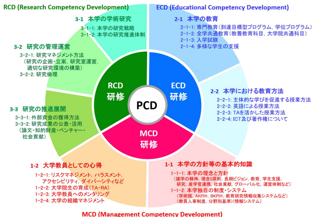
<図 2 本学の PCD (Professional Competency Development) 研修体系>