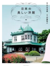
日本の美しい洋館 伊藤隆之写真 エクスナレッジ 2023