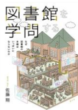
図書館を学問する 佐藤隆著、青弓社 2024

図書館サポーターHULSが学生の視点から選んだ、 学習に必要な本や後輩にすすめたい本です。 今年も西図書館2階に多数展示しています。