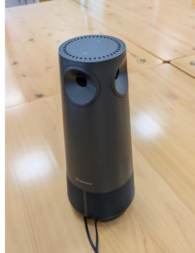
(2) マイクスピーカー・カメラ （一体型）