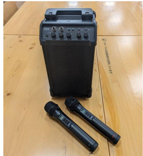
(6) ポータブルスピーカー1台・ワイヤレスマイク2本 (サンワサプライ)