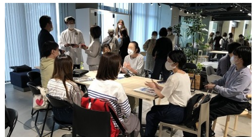
個別に交流・意見交換