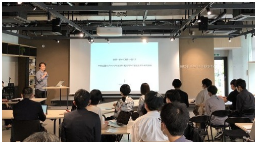
地域の方からのプレゼン