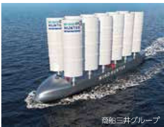
商船三井グループ