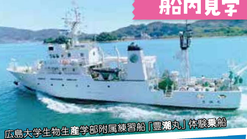
広島大学生物生産学部附属練習船「豊潮丸」体験乗船