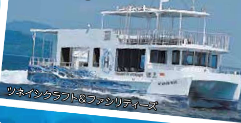
ツネインクラフト&ファシリテーズ