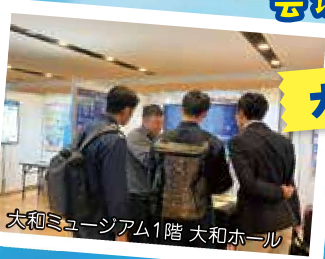
大和ミュージアム1階 大和ホール