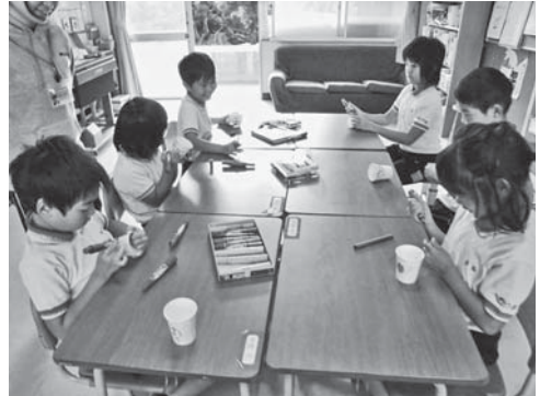
紙コップロケット作り

特別支援学級中学年は、生活単元学習の中でおもちゃ作りに取り組みました。中学年という段階から、作って終わりではなく、作ったおもちゃで友だちと一緒に遊んだり、工夫したところや、気に入っているところを友だちに伝えたりする楽しさを味わってほしいと考えました。