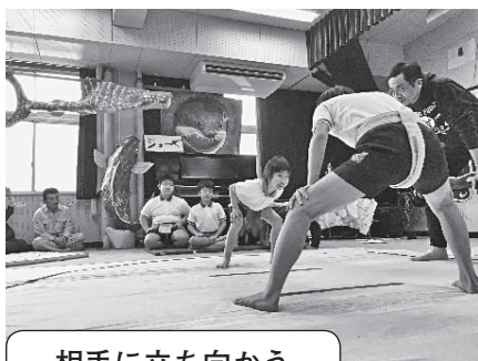
相手に立ち向かう

相撲は体格が良い方が有利です。しのめすもう大会では、養護学級の1から6年生と一緒に取組を行うので、高学年の方が勝つことが多くなります。練習では縦のつながりから、たくさん学ぶことができるようにしています。