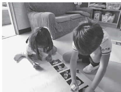
おもちゃの紹介ポスター作り

第1回目は、研究会で、お客さんは会員の方々という設定でした。6人の子どもたちは、初対面の会員の方々におもちゃの作り方や遊び方を紹介したり、一緒におもちゃで遊んだりして、自分たちで屋台を運営していくことができました。