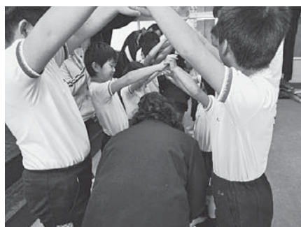
最後はアーチでお見送り

をしたり、また学校案内をしたりと楽しい時間を過ごすことができました。少しの時間でしたが、名前と呼んでいたり、自然に会話をしたりしている姿に今回の取り組みの成功を感じました。