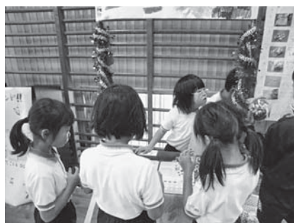
2年2組とのハッピーランド

この経験が今後、高学年や中学校での「他者が喜ぶことを期待しての活動」へとつながっていくと考えています。