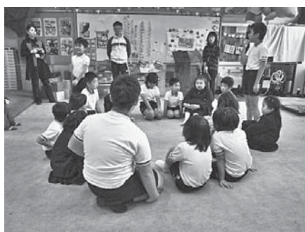
一緒にハンカチ落とし