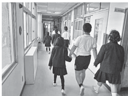
はりきって学校案内

その後、お礼の手紙と電話番号を6年生が代表して書きました。その手紙が届くと話が進み、テレビ電話で顔を見ながら袋町小学校の友達と話をすることができ、お互いに顔やどんな友だちかを知ることができました。そして、とうとう袋町小学校の友だちが12月のある日、東雲小学校へ遊び