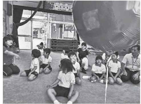
これから風船を飛ばします

9月のある日養護学級合同の国語の時間に「花いっぱいになあれ」という本を読み聞かせをしました。キツネが赤い風船に花の種をつけてとばすというお話です。その風船は遠くまで飛んで行ってそこで花を咲かせるというもので、話を聞いた子どもたちに風船を飛ばしてみようと投げかけました。子どもたちは大変興味をもち、ぜひ自分たちもやってみたいということになりました。