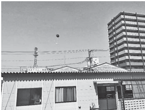
西の空へ飛んでいく赤い風船

風船は絵本と同じ赤い色のものを準備し、ひもの先には手紙を付けるようにしました。手紙は6年生が代表して書き、内容は「この風船を拾ってくれた人、お手紙ください」と学校の住所と養護学級の名前を書きました。天気の良い日、合同教室からみんなで外へ飛ばしました。風船は西の空へ飛んで行きました。