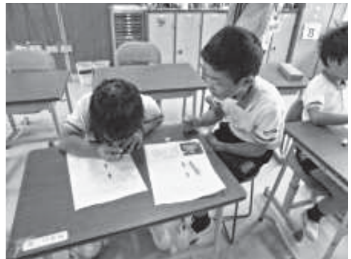
紹介するおもちゃ選び

養中の6人の子どもたちで3年生と4年生1人ずつでペアになり、3グループそれぞれが、これまでに作ったおもちゃの中でどれを発表したいか相談して決めていきました。発表するおもちゃは、でんでん太鼓、色紙ヨーヨー、紙コップロケットの3種類となりました。