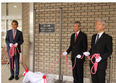
(左から越智学長、木内理事・副学長、木原副学長)

当センターは、本学におけるシーズの開発および管理と二元的なパイプラインの確立により関連機関との連携を強化する「橋渡し研究」の推進、またそれらを担う人材の育成を目的に、本学医療系トランスレーショナルリサーチ推進機構の下、本年4月に設置された。