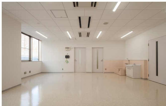
保健管理センター