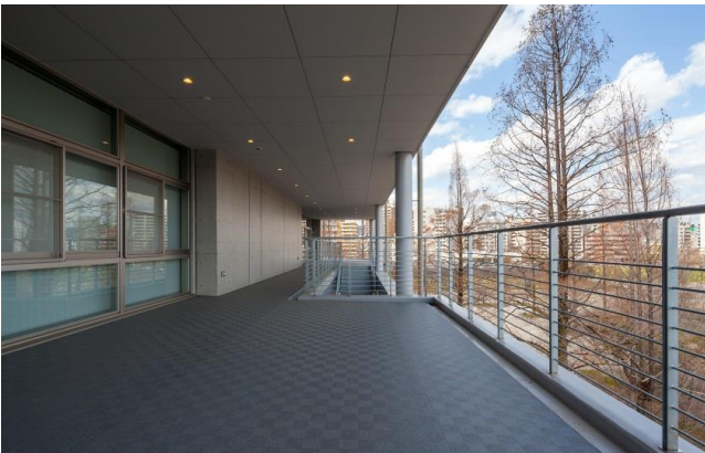
リフレッシュデッキ