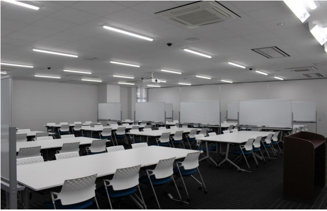
グループワーク室