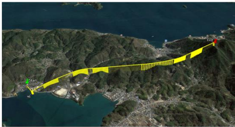
みゆき～神峰山 飛行ルート図

※離着陸含め約12分のフライト ※着陸地点上空で30秒間の停止アクション (着陸地点直下の安全確保)