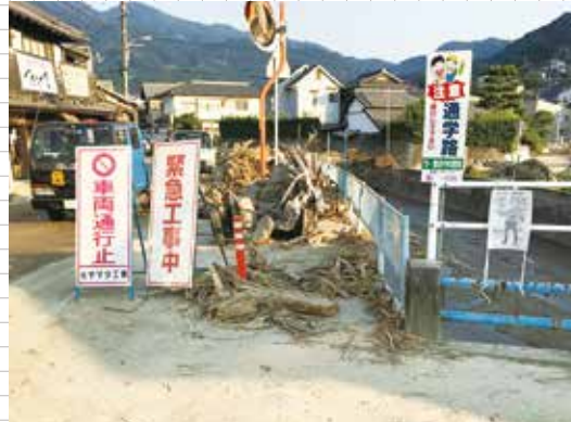
坂町町民センター付近