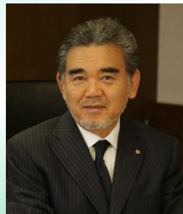
越智 光夫 広島大学長

広島大学は、平和を希求してチャレンジする国際的教養人を輩出し、多様性を育む自由で平和な国際社会を築く役割を果たします。ピース・レクチャー・マラソンは、原子爆弾によって破壊された広島が緑豊かな国際都市として発展する中、苦難の歴史を忘れず平和の大切さを語り継いでいくために、各国政府代表者や在京大使の方々に平和をテーマにご講演いただくものです。