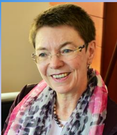
パトリシア・フロア 駐日欧州連合特命全権大使

1961年ドイツ生まれ。ハーバード大学ケネディ行政学院で行政学修士号取得。エアランゲン・ニュルンベルク大学で東欧史、経済、哲学を学び博士号を取得。ジャーナリストとして活動後、学術研究を経て、1992年ドイツ外務省に入省。国連ドイツ政府代表部勤務中には、国連女性の地位委員会議長を務める。中央アジア担当欧州連合特別代表、ドイツ外務省国際秩序・国連・軍備管理総局長兼軍縮・軍備管理担当政府代表を歴任。2018年11月に駐日欧州連合特命全権大使に就任。