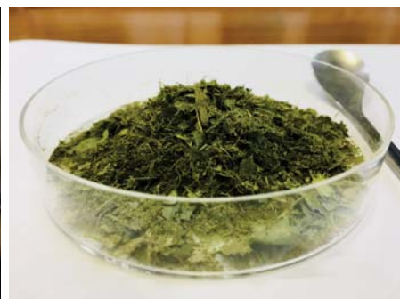
抗疾病作用を示すハーブ植物