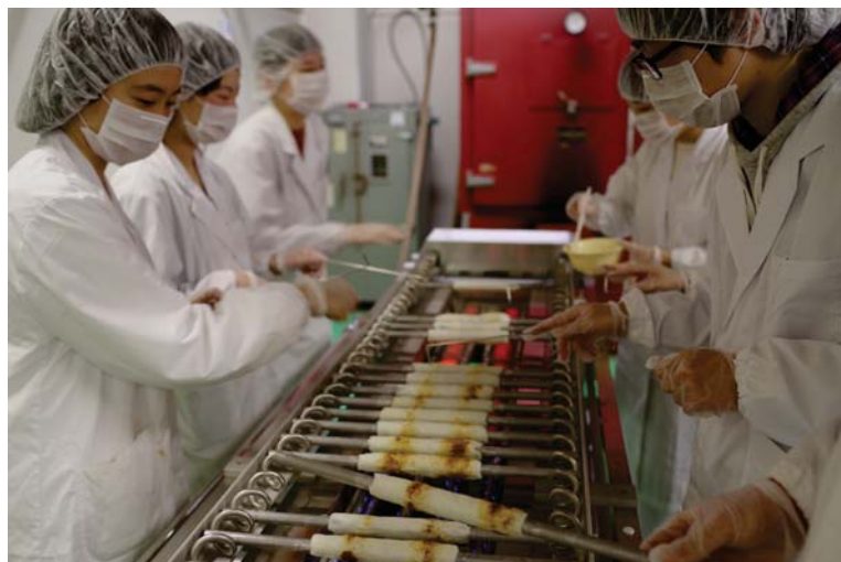
食品製造実習風景