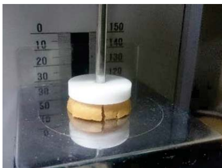
クッキーの食感の解析