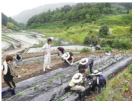
棚田でのフィールド調査

食の安全性の中でも食中毒は大きな問題です。食中毒を防ぐさまざまな抗菌性物質の中には、天然植物素材も含まれます。ヒトや環境に優しい天然植物素材を利用して食中毒菌や食中毒ウイルスを撃退し、ヒトの健康を守る研究を行っています。