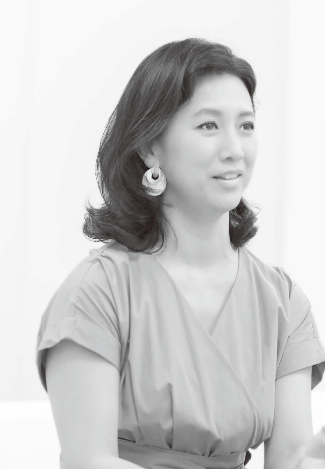
俳優 戸田菜穂さん 1974年広島市生まれ。玉川大学文学部外国語学科（フランス語専攻）卒業。第15回ホリプロタレントスカウトキャラバングランプリを受賞し、翌年芸能界デビュー。NHK連続テレビ小説「ええにょぼ」でヒロインを演じる。その後、多数のドラマ・映画に出演。「NHK俳句」の第3週司会を担当。舞台や司会にも挑戦し、さらに活躍の場を広げている。趣味は、俳句、三味線、小唄。著書に「恋俳句レッスン 俳句は恋を育てる」（マガジンハウス）など。

戸田 国際交流が進むと多様性が増え、良いネットワークづくりもできますね。就職の面でも「企業人事担当者から見た大学イメージ調査」で、広島大学が上位に入ったという記事を見て驚きました。何がポイントになったのでしょうか。