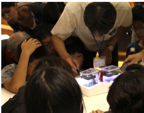
新素粒子発見？放射線の足あとが見えた！

話がはずんでくると、いろいろ聞きたいことが出てきます。 サイエンスカフェでは話の途中の質問は大歓迎です！