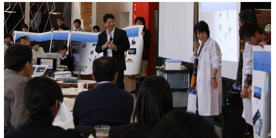
極小の素粒子から宇宙の果てまでを一望する！

進行役の“ファシリテーター(聞き手)”が、ときには 小道具などを使って、話の内容をより分かりやすく皆 さんに伝える手助けをしてくれます。