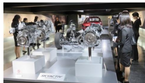
(平成26年度企業訪問の様子)