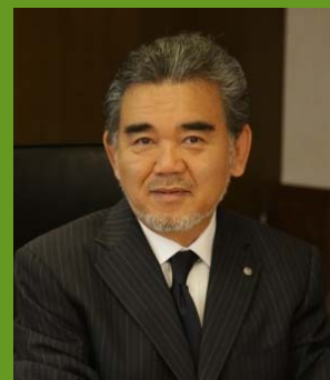
土屋 定之 駐ペルー日本国大使

広島大学は、平和を希求してチャレンジする国際的教養人を輩出し、多様性を育む自由で平和な国際社会を築く役割を果たします。ピース・レクチャー・マラソンは、原子爆弾によって破壊された広島が緑豊かな国際都市として発展する中、苦難の歴史を忘れず平和の大切さを語り継いでいくために、各国政府代表者や在京大使・在外の日本国大使の方々に平和をテーマにご講演いただくものです。