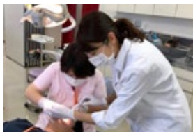
超音波スケーラーやPMTCなど臨床手技の習得