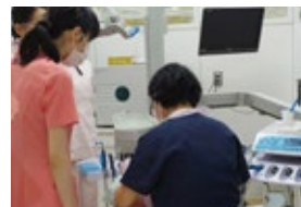
大学病院歯科診療科や歯科医院、高齢者施設などでの見学実習