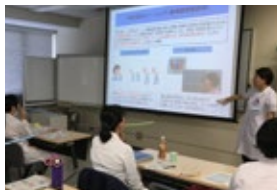
充実した講義科目、少人数での講義