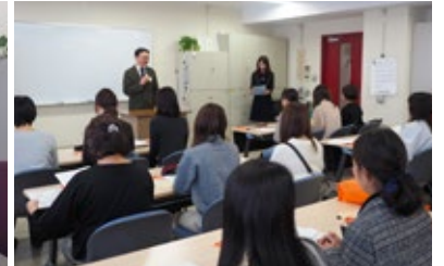
オリエンテーション風景