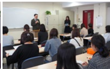
オリエンテーション風景