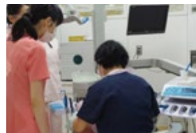
大学病院歯科診療科や歯科医院、高齢者施設などでの見学実習