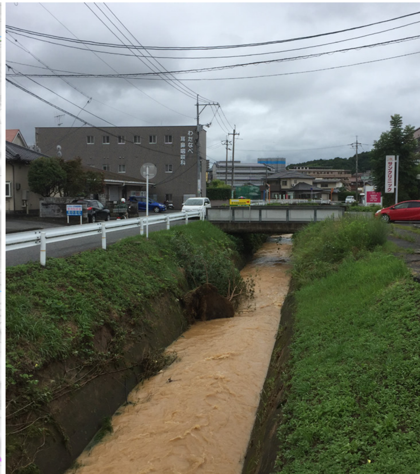
① 西条地区の河川の増水