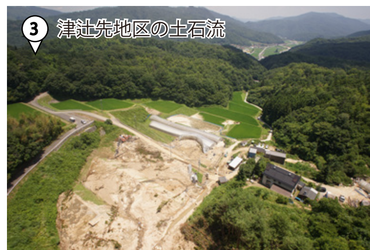
③ 津社先地区の土石流