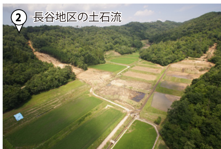
② 長谷地区の土石流