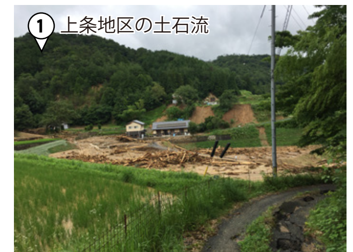
① 上条地区の土石流