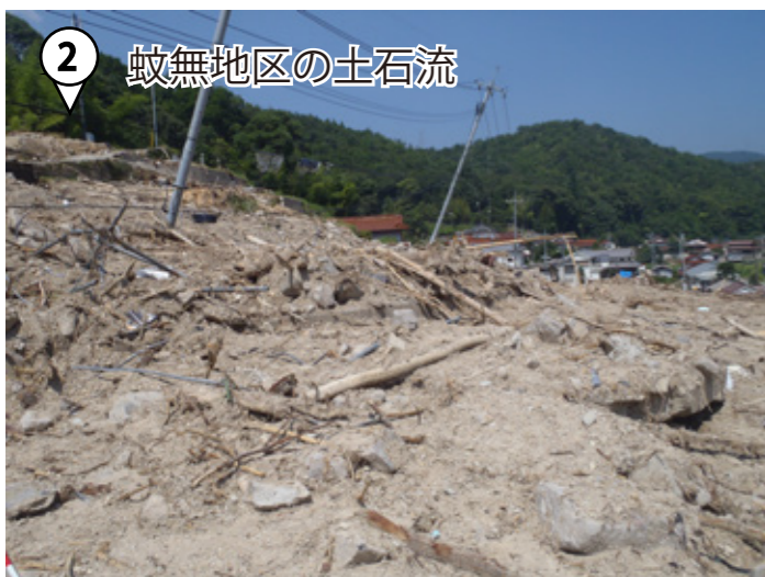
② 蚊無地区の土石流