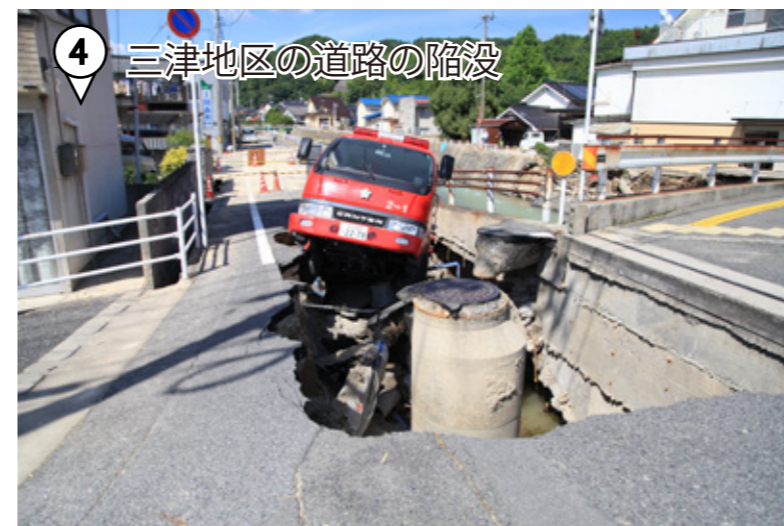
④ 三津地区の道路の陥没