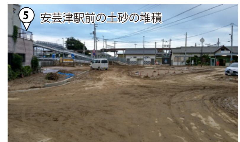
⑤ 安芸津駅前の土砂の堆積