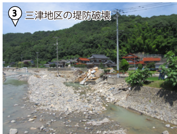
③ 三津地区の堤防破壊