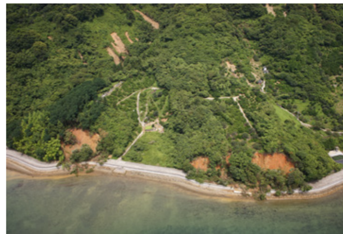
④ 大芝南地区の崖崩れ