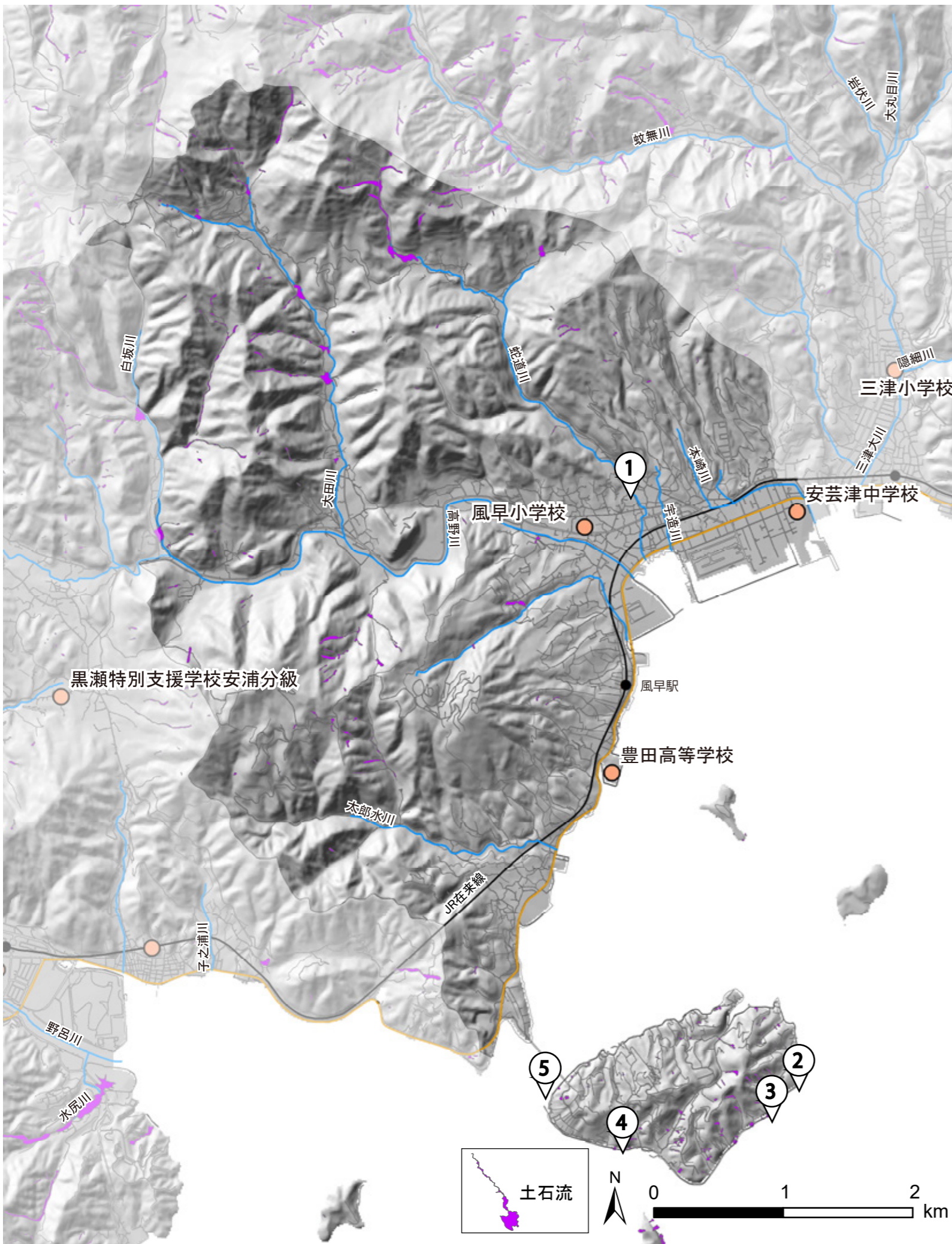
① 蛇道川の堤防破壊