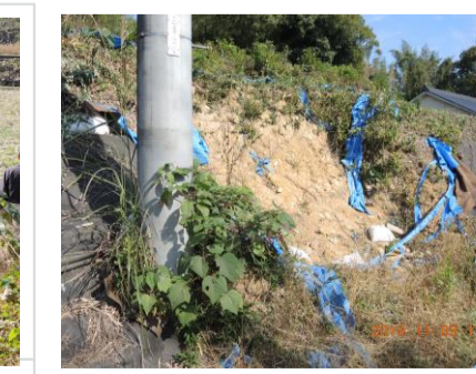
③⑮道路のり面土砂崩れ