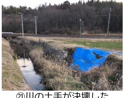
③⑭川の土手が決壊した