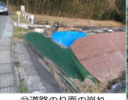
③③道路のり面の崩れ