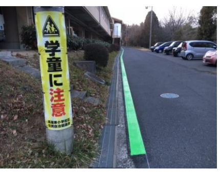
③歩道狭く歩行者注意