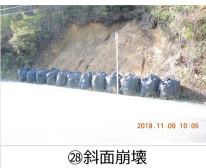
②⑧斜面崩壊 2車線道路ほぼ塞ぐ