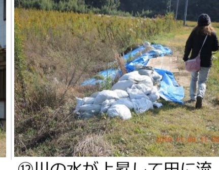
③⑫川の水が上昇して田に流出した