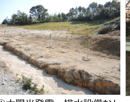
④太陽光発電 排水設備なし