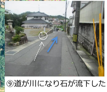
⑨道が川になり石が流下した