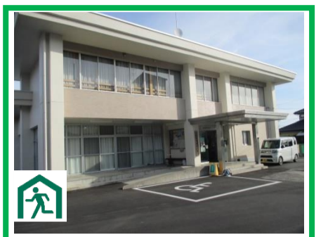
⑥高屋東地域センター 第一避難所