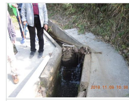
③⑰水が側溝から流れて田んぼに流出