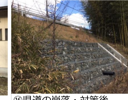
③⑩県道の崩落・対策後