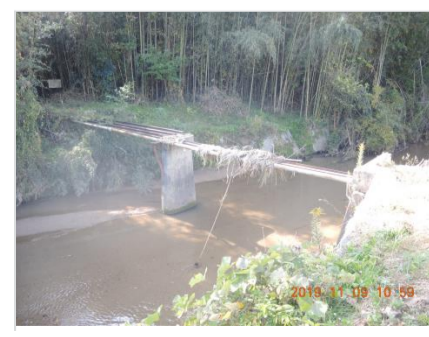
③⑬橋の上面土砂流出

危険個所を把握し避難遅れにならないための留意事項 ①勾配のある道路が川になる。②土砂災害警戒区域内や裏山がある家。 ③谷合いの避難路の土砂災害の可能性。④川や溜池の溢れによる通行阻害。