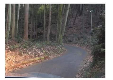
⑪道の勾配が急で避難が不安