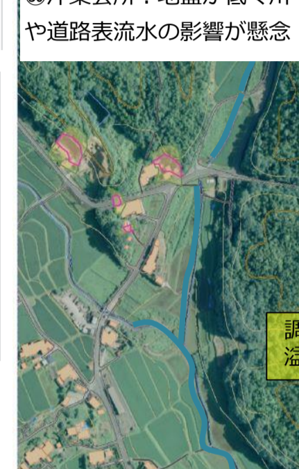
②⑩沖集会所：地盤が低く川や道路表流水の影響が懸念