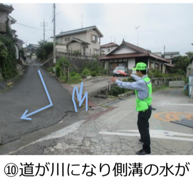
⑩道が川になり側溝の水がコーナーの樹から噴水した