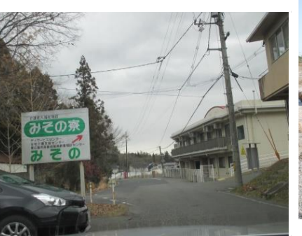
②⑦みその寮 老人福祉施設