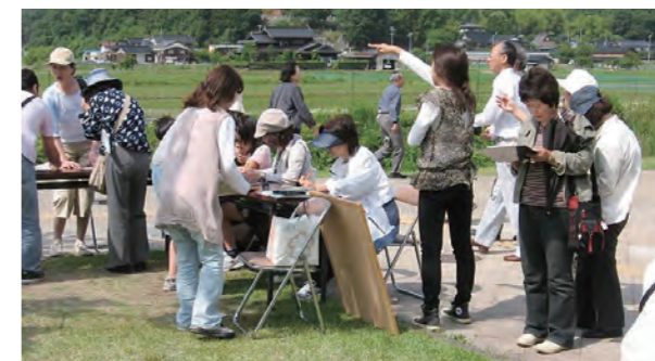
調査実習風景(観光地でのアンケート)

フィールドワークは、地域社会を研究するための重要な作業のひとつです。「現場」の人々との交流、社会環境の観察などから考察を進めるこの作業と、文献資料研究とを組み合わせることで、地域社会のリアリティに迫ります。社会フィールド研究授業科目群は、フィールドワークという調査法を活用する文化人類学、地理学、社会学、観光研究などを学ぶ授業科目で構成され、地域社会が抱える文化景観の保存、観光の発展、環境の保全、地域づくり、伝統文化の構築などの課題に関して、「現場」で考える姿勢の習得をめざします。