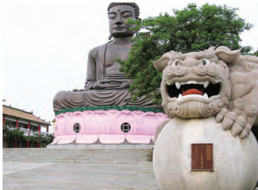
台湾彰化八卦山の仏と石獅子

地域研究授業科目群は、大きなエリアとして日本を含む広域アジア、広域ヨーロッパ、広域アメリカを想定しながら、国や地域の特色を歴史、社会、政治、思想、文化、文学などさまざまな視座から研究する学際的な授業科目群です。現代世界のさまざまな問題に対応するため、諸地域が歩んできた歴史と培ってきた営為への真摯な見識、未来を見通す洞察力が求められています。また他の授業科目群とも連携しながら、グローバルな視点から地域を、ローカルな視点から世界を、地域と世界を複眼的に考える方法を学びます。