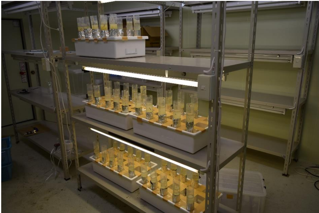
写真2 培養実験の様子。採取した土壌と灌漑水をプラスチックケースに詰めて30日間培養室で培養した。室内の明かりと温度は5月の現地状況を再現するように設定している。