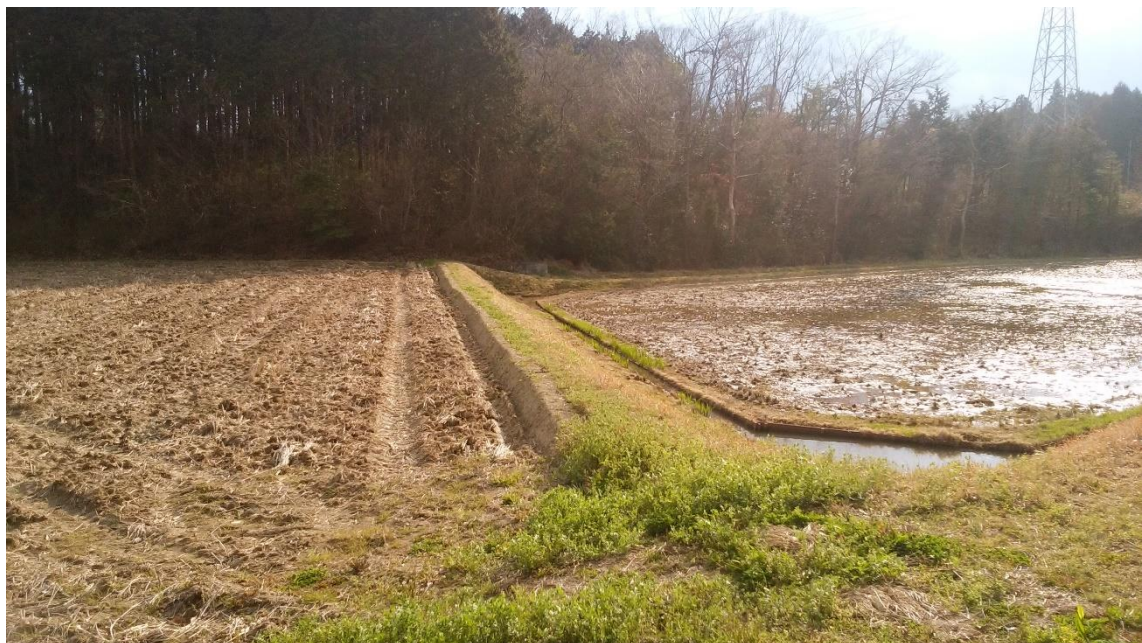
写真1 冬季湛水の様子。右が冬季湛水水田で、左が慣行農法の水田。慣行農法では、稲刈り後水田は乾田化している。