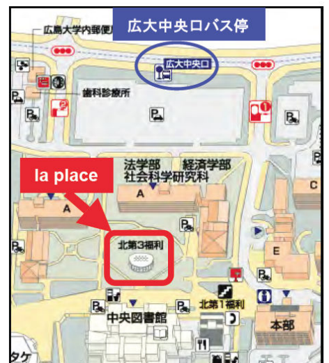
広島大学東広島キャンパス地図