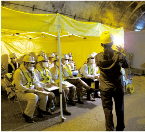
被験者に実験内容を説明する様子