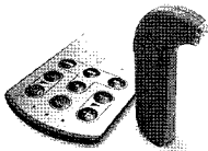
人工内耳 スピーチプロセッサ