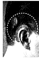
人工内耳(プロセッサ)を装着している様子

補聴器を使ってもよく言葉が聞き取れない方は、人工内耳の装着によって改善する可能性がありますので、専門の医療機関でご相談ください。