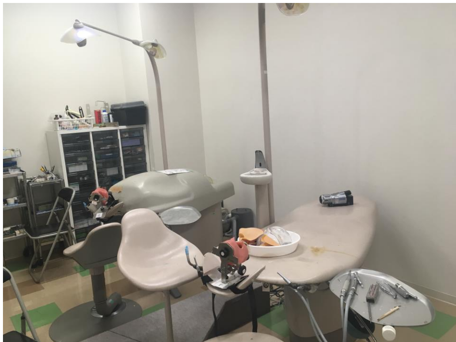
セミナー室には自習用の模型有り