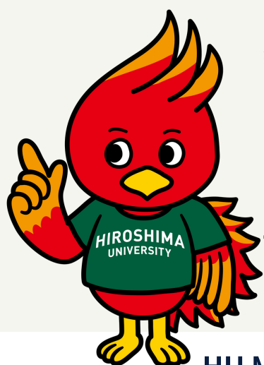
HU Mascot "ひろティー" (Hiroty)

学生・教職員の方で、新型コロナウイルスのPCR/抗原検査を受ける(受けた)方、感染と診断された方、および、濃厚接触者となった方は、広島大学保健管理センターのページよりWEB入力でお知らせください。必要に応じて不安やご質問にお答えします。(✉ E-mail: health@hiroshima-u.ac.jp)