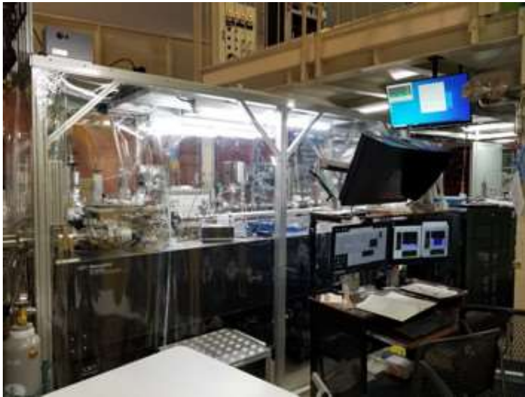
【固体有機物分析チーム】 高エネルギー加速器研究機構に設置された軟 X 線顕微鏡。固体有機物の構造や分布を明らかにする。