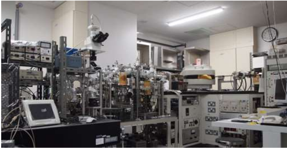
【揮発性成分分析チーム】 コンテナから採取されたガスや固体粒子中のガスに含まれる希ガスを分析する質量分析装置（九州大学）。