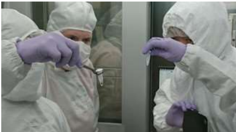
【可溶性有機物分析チーム】 九州大学地球外有機物専用クリーンルームでの分析リハーサル。