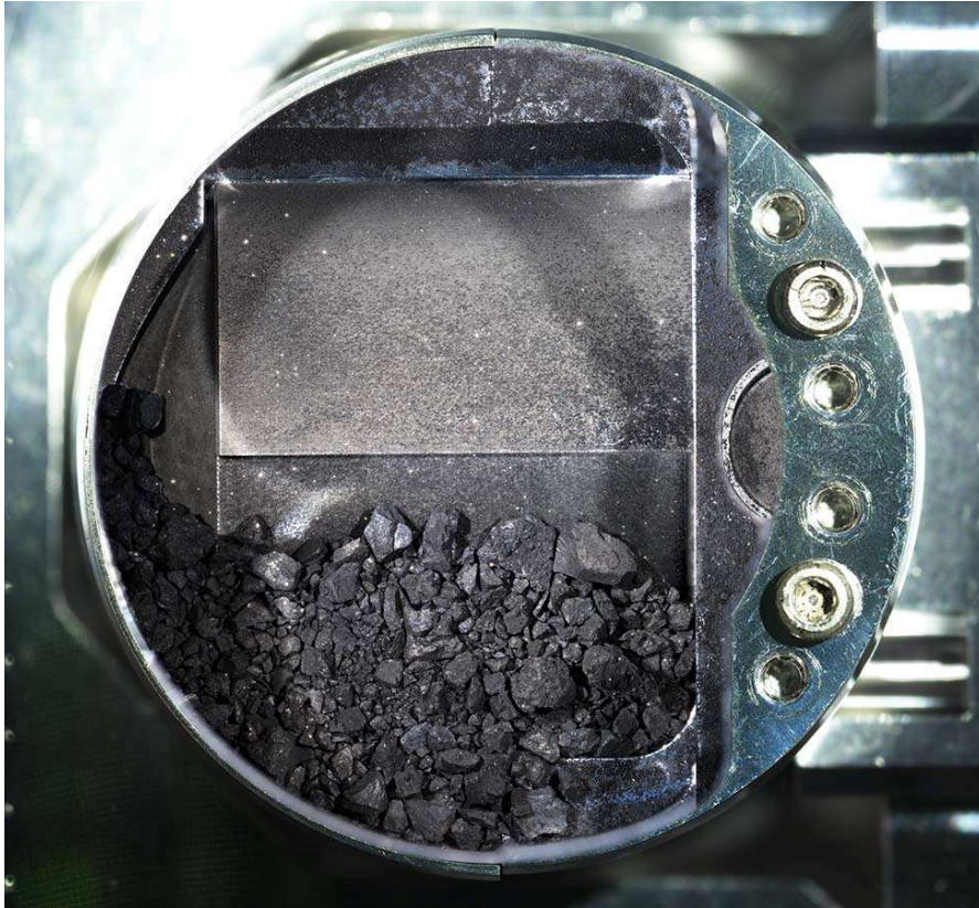
「はやぶさ2」 サンプルキャッチャ内の粒子。第一回目のタッチダウン時に採取されたものと考えられる。キャッチャ円筒の直径は48 mm。