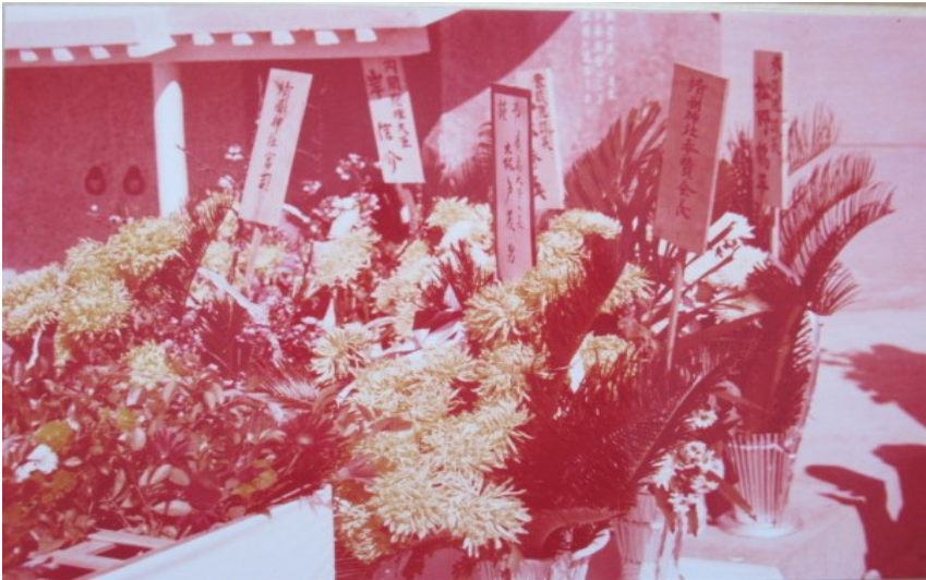
那覇市、識名霊園にて行われた全琉球戦没者追悼式における、戦没者中央納骨所前の献花、（沖縄タイムス社の調査による）岸信介総理大臣の木札の隣に森戸辰男の木札が確認できる