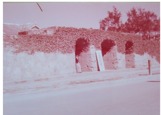
那覇市、崇元寺。内部に琉米文化会館の屋根が確認できる （沖縄タイムス社の調査による）