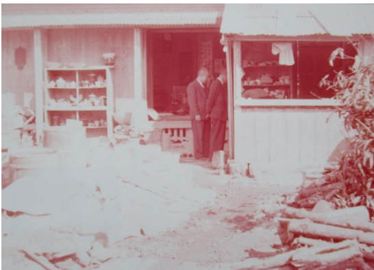
那覇市、壺屋の新垣製陶所。 （沖縄タイムス社の調査による）