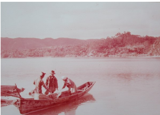
名護市、屋我地島と沖縄本島間の渡し船 （沖縄タイムス社の調査による）