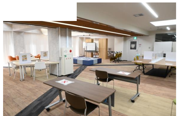
ダイバーシティエリア 室内