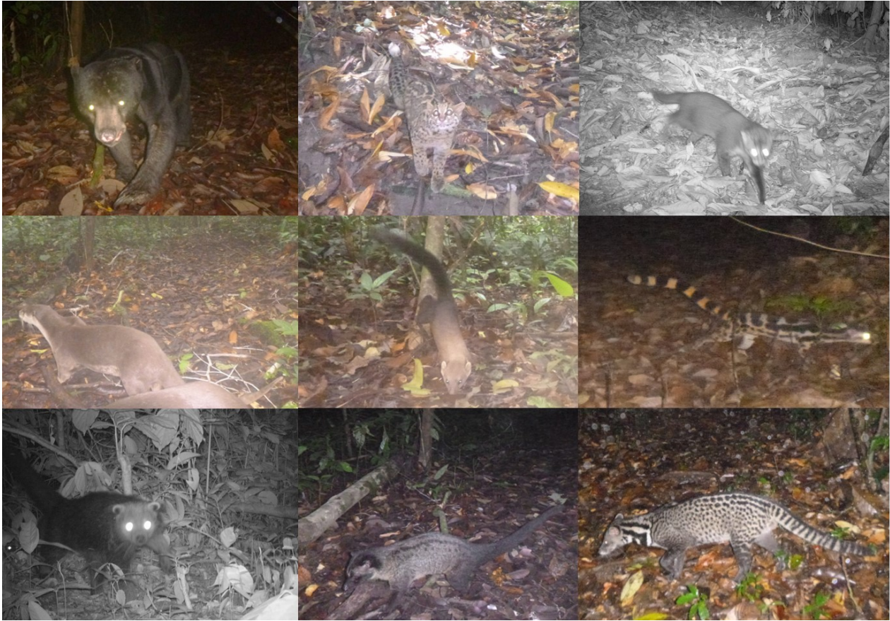
図1. 撮影された食肉目動物の一部。左上から右下に：マレーグマ、マーブルドキャット、マレーヤマネコ、ピロードカワウソ、キエリテン、オビリンサン、ピントロング、パームシベット、マレーシベット