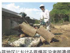
2018年4月の似島小筏地区における原爆死没者御遺骨発掘作業の際に伐採したエゴノキ。この樹木から3~4m離れた地点から被爆者とみられる御遺骨が発見された