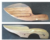
エゴノキ材で製作したあご当て(上面/写真上)と(側面/写真下)