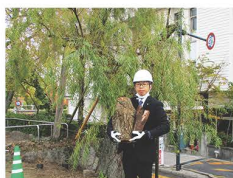
2017年12月の養生作業の際に腐食部分を切断した際に被爆シダレヤナギ