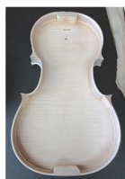
製作途中のヴァイオリン(写真左/裏板の内側と側板。製作ラベルは貼っていない状態。写真右/裏板の象嵌細工。焦げ茶色の部分がシダレヤナギ材)