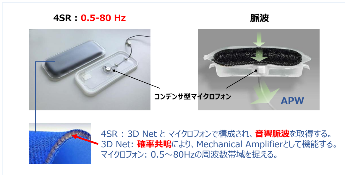
生体信号計測用センサ：4SR システム