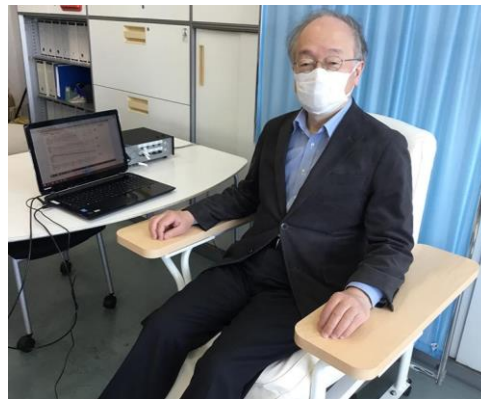
計測風景（胸部の背面、腰部などから脈波採取中）