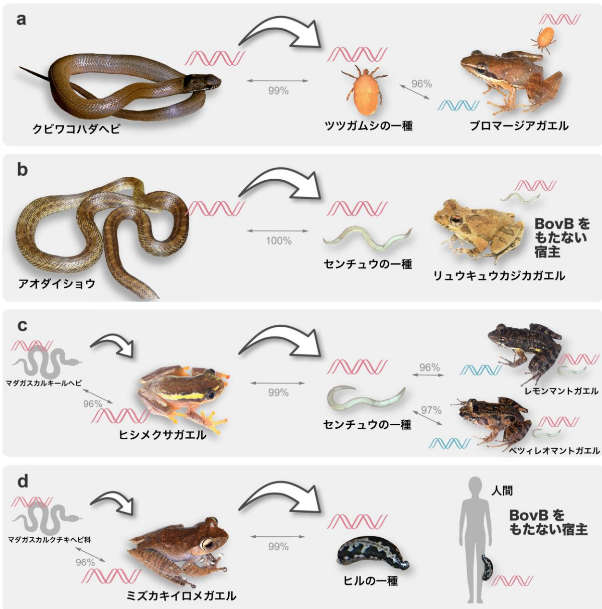
図 1. 寄生虫を介した水平伝播経路の代表例。太い矢印は伝播の方向、細い矢印は動物間の BovB の塩基配列相同性を示す。赤色の DNA は、ヘビからカエル、もしくは、ヘビから寄生虫に水平伝播した BovB、青色は、カエルが元々もっていた寄生虫とは異なる BovB を示す。