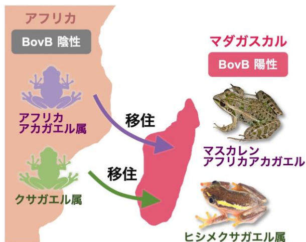
図3. これら2系統のカエルでは、アフリカからマダガスカルへ移住した後に水平伝播が生じた

続いて、水平伝播の経路を調査するため、ヘビ-カエル間を行き来することのできる寄生虫を水平伝播の仲介者と仮定し、PCR法（注3）による調査を行ったところ、BovBをもったまま宿主間を移動している有力な仲介者候補が発見されました（図1）。