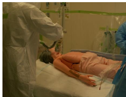
模擬患者への処置

北陸電力志賀原子力発電所における災害に伴う被ばく医療措置訓練を、診療放射線技師1名が訓練評価、診療放射線技師1名が指導助言、支援センタースタッフ2名が視察した。