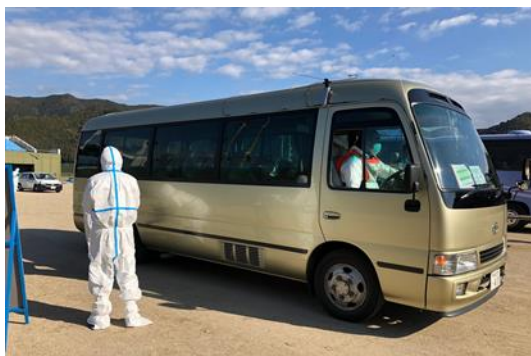
住民乗車バス到着