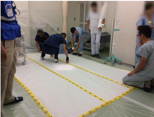
傷病者受入準備（養生）