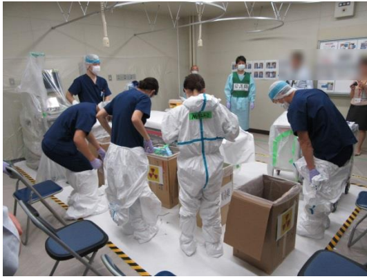
医療処置を終えて防護服の脱衣