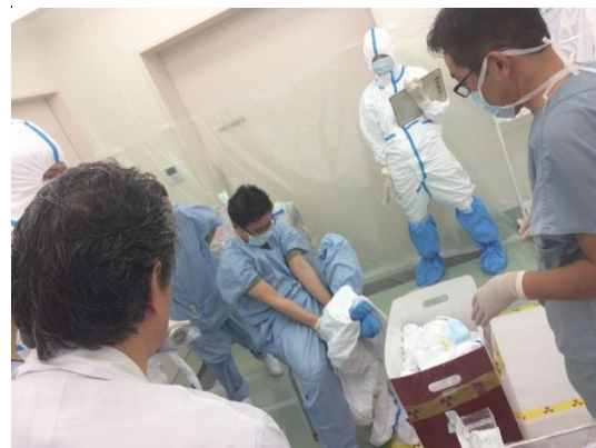
医療処置を終えての脱衣