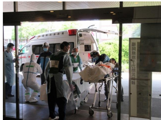
傷病者到着（救急車）