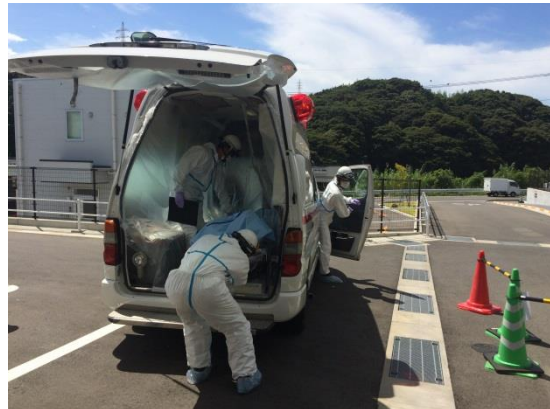
傷病者到着（救急車）