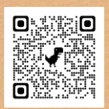
申し込みフォーム

駐車台数が限られておりますので、出来るだけ公共交通機関または乗り合わせでお越し願います。