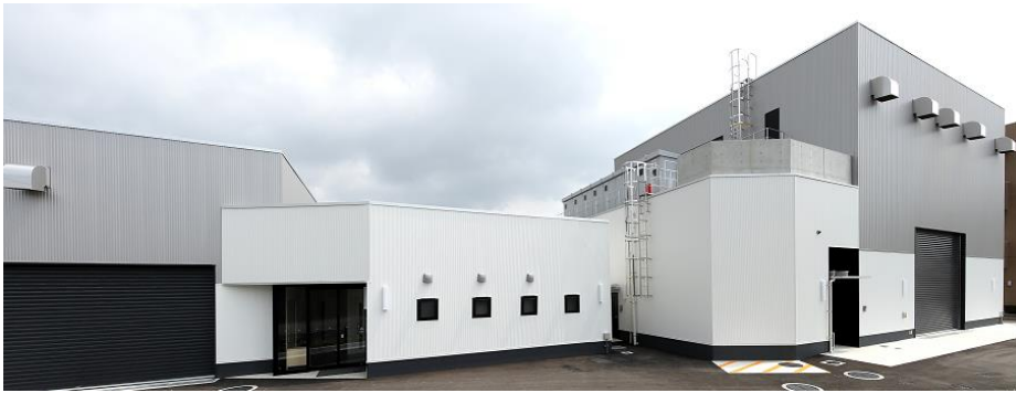
(左) データ駆動型研究棟