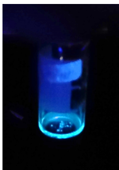
図2：ブラックライト照射時のピメフォラジン A による青白い蛍光