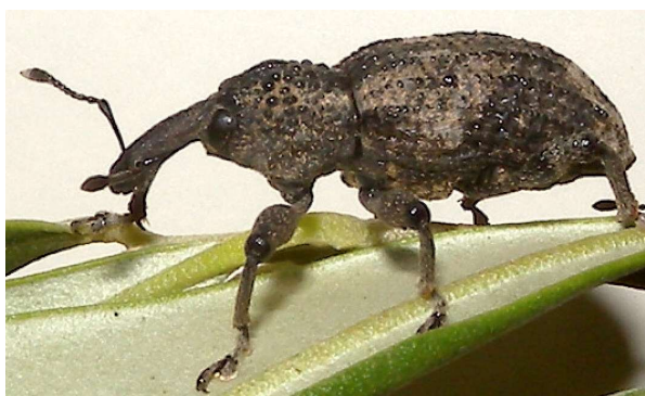
図1：オリーブアナアキゾウムシ（体長約 1.5 cm）

* 3) アルカロイド化合物：植物や昆虫などが生産する窒素原子を含む化合物の総称。