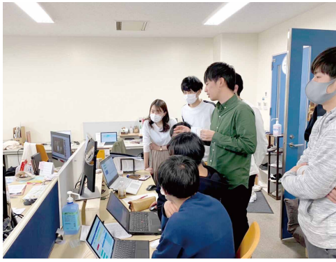
研究室学生へのGIS講習の様子