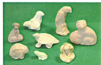
広島城跡から出土した土人形