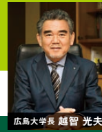
広島大学長 越智 光夫