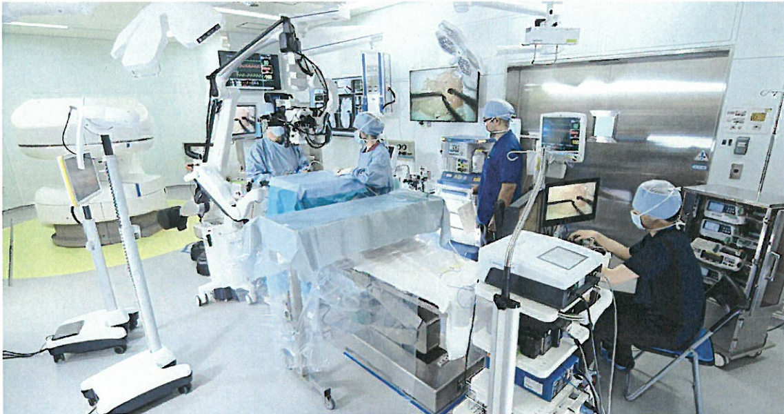
スマート治療室基本仕様モデル（広島大学病院）

つきましては、広島大学病院に完成した「スマート治療室」をメディアの皆さまに公開させていただきたく、記者説明会を下記のとおり広島大学病院にて開催いたします。ご多用の折とは存じますが、ご参集くださいますようお願い申し上げます。