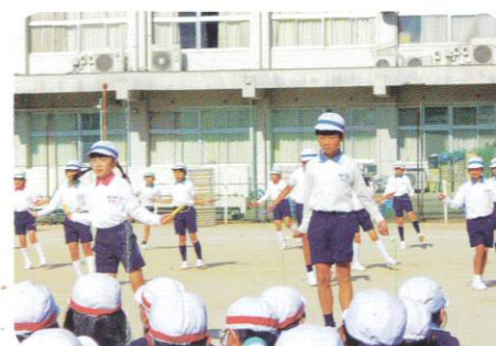
リズムなわとび大会