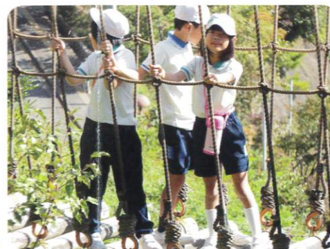
三滝宿泊学習(特別支援学級)